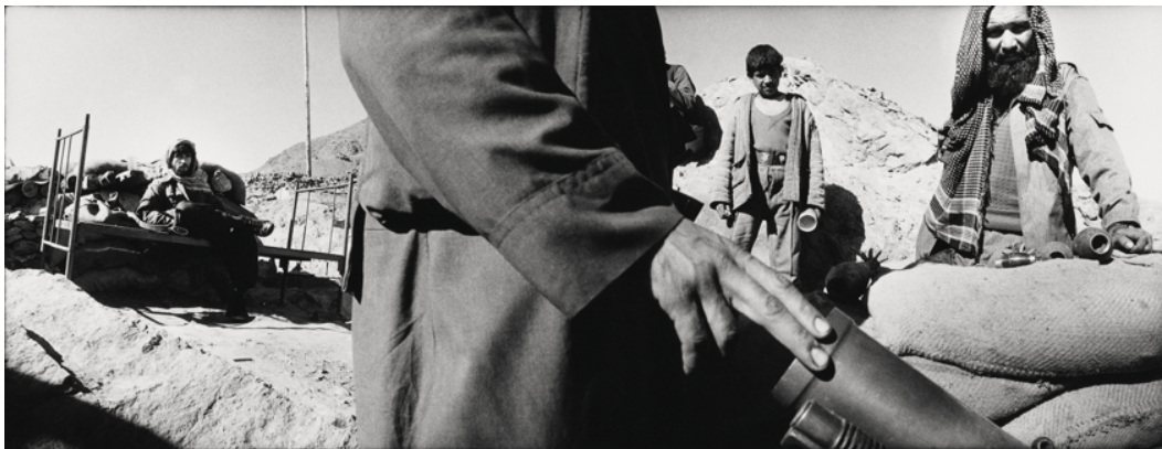
Wolf Böwig, The Great Game, Afghanistan, 1994. Analogue photo print, mounted, framed, 181 x 70 cm, ed. 1 + 1 AP

Wolf Böwig's photographs, leporellos and collages are multi-layered works of art that, in their concept of „expanded photography“, go far beyond the documentary. In this retrospective, Wolf Böwig shows not only some of his iconic photographs, but also large, impressive sequences of images that he sometimes overwrites by hand and in which he combines his image-text overlays with maps, newspaper clippings and objects from his travels. Thus, he creates unique collages that testify in their materiality to what Böwig has seen, experienced and researched on his expeditions to the margins of our perception.